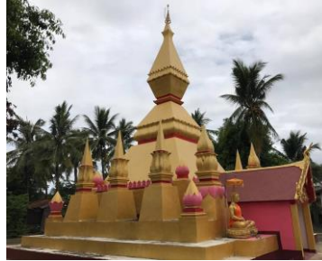
ວັດແສນໄຊຍະມຸງຄຸນ