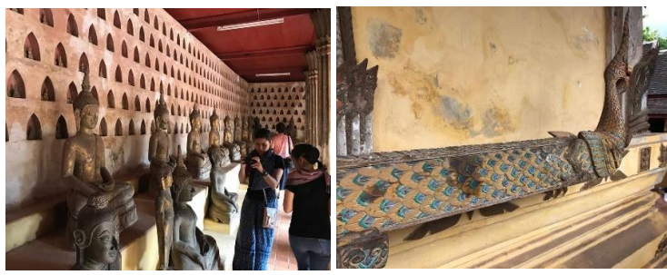
ວັດສີສະເກດ

ຕັ້ງຢູ່ຝັ່ງກົງຂ້າມກັບຫໍພະແກ້ວ ເປັນວັດເກົ່າແກ່ທີ່ສຸດ ແຫ່ງໜຶ່ງຂອງເມືອງວຽງຈັນ ສ້າງຂຶ້ນຄັ້ງທຳອິດເມື່ອປີ ຄ.ສ. 1818 ເນື່ອງຈາກໃນສະໄຫມນັ້ນລາວຕົກເປັນເມືອງຂຶ້ນຂອງສະຫຍາມ ເຈົ້າອະນຸວົງຈຶ່ງອອກແບບວັດຕາມສີລະປະໄທສະໄຫມລັດຕະນະໂກ ສິນຕອນຕົ້ນ ແລະນັ້ນອາດເປັນສາເຫດສຳຄັນຢ່າງໜຶ່ງທີ່ເຮັດໃຫ້ ທັບສະຫຍາມບໍ່ທຳລາຍວັດແຫ່ງນີ້ລົງ ຫລັງຈາກບຸກເຂົ້າ ນະຄອນຫລວງວຽງຈັນໄດ້ໃນປີ ຄ.ສ. 1828 ວັດສີສະເກດຈຶ່ງອາດ ນັບເປັນວັດທີ່ເກົ່າແກ່ທີ່ສຸດໃນເມືອງເພາະວັດອື່ນໆ ທີ່ເຫລືອທັງ ຫມົດລ້ວນແຕ່ເປັນວັດທີ່ສ້າງ ຫລືບູລະນະຂຶ້ນໃຫມ່ຫລັງກຸງແຕກ ໃນຄັ້ງນັ້ນທັງຫມົດ ຝາຜະຫນັງດ້ານໃນຂອງພະລະບຽງທີ່ລ້ວມ ອຸໂບສິດນັ້ນ ມີການເຈາະຊຸ້ມນ້ອຍໆ ຂຶ້ນສຳລັບປະດິດສະຖານພະ ພຸດທະຮູບເງິນແລະພະພຸດທະຮູບດິນເຜົາກວ່າ 2,000 ອົງ ສ່ວນ ໃຫຍ່ເປັນພະທີ່ສ້າງຂຶ້ນທີ່ວຽງຈັນໃນໄລຍະສັດຕະວັດທີ່16 ເຖິງ19 ລະບຽງດ້ານຕາເວັນຕົກເປັນທີ່ເກັບລວບລວມຊື້ນສ່ວນພະພຸດທະ ຮູບທີ່ຖືກທຳລາຍໃນສົງຄາມ ດ້ານຫລັງພະອຸໂບສິດມີລາງໄມ້ຮູບຊົງ ຄ້າຍພະຍານາກໃຊ້ເປັນລາງສຳລັບຈົງນ້ຳພະໃນເທສະການສົງການ ໂດຍສະເພາະ ທາງຊ້າຍເປັນຫໍໄຕທີ່ສ້າງຕາມແບບສີລະປະພະມ້າ.