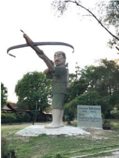
ແກ່ງຄຸດຄູ້