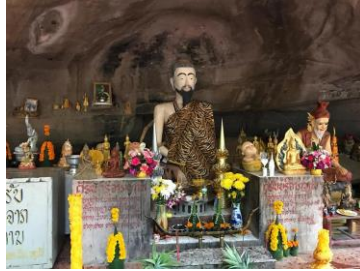
ວັດປ່າຖ້າພະລິສິວະນາລາມ