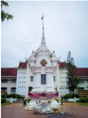
ອະນຸສາວະລີປາບຮີ້