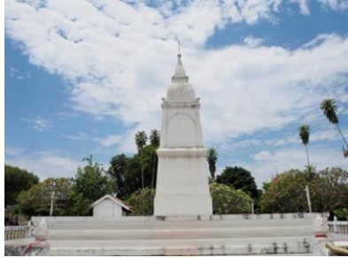
ພະທາດມະນາວດ່ຽວ