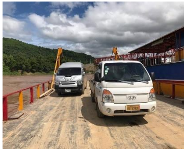
ທ່າເຮືອບັກ ຂ້າມແມ່ນໍ້າຂອງ ເມືອງປາກລາຍ