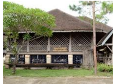
ພິພິທະພັນພື້ນບ້ານ ວິຈານສັງຂະກິດ ວັດສີຈັນ