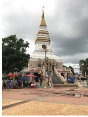
ພະທາດຫລ້າຫນອງ ກາງນ້ຳ