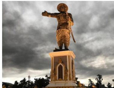
ອະນຸສາວະລີເຈົ້າອະນຸວົງ