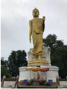
ພະໃຫຍ່ພູຄົກງ້ວ