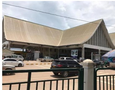
ດົວຕີ້ຟຣີ ດ່ານຂົວມິດຕະພາບໄທ-ລາວ