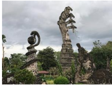
ສາລາແກ້ວກຸ່