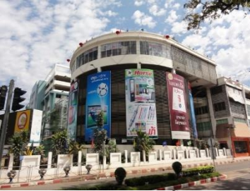
ຕະຫລາດເຊົ້າ ແລະຕະຫລາດເຊົ້າມ່ວນ