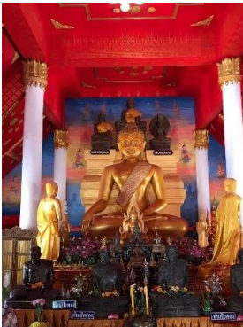
ວັດທ່າແຂກ