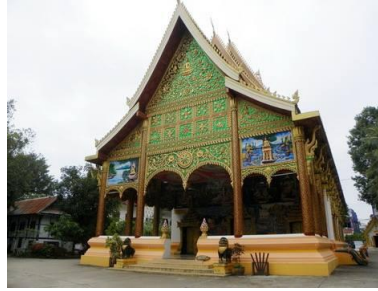
ວັດອິນແປງ