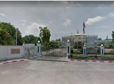
ທຳນຽບປະທານປະເທດ