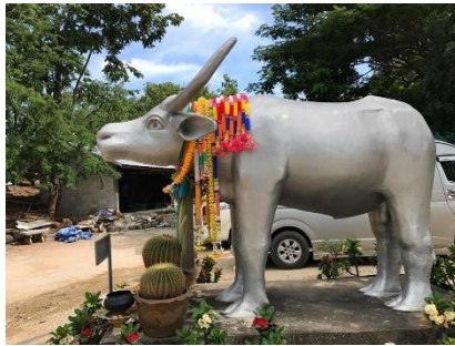
ວັດພະບາດພູຄວາຍເງິນ