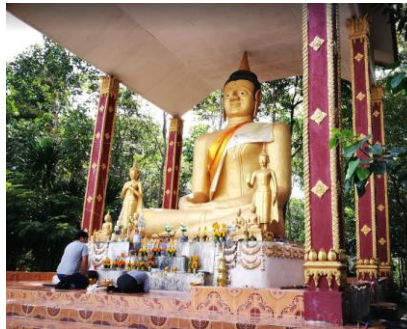
ວັດຖ້າຄອກມ້າ