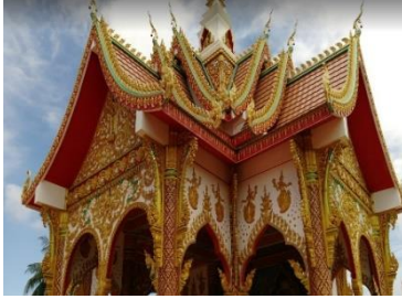
ວັດທາດຝຸນ