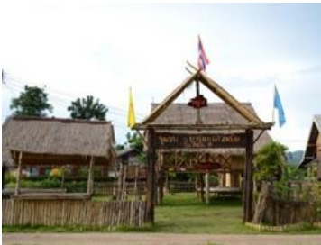
ຫມູ່ບ້ານວັດທະນະທຳບ້ານນາອ້

ພິພິທະພັນແຫ່ງນີ້ໃຊ້ກຸຕິເກົ່າຂອງພະອຸວິຈານສັງຂະກິດເປັນອາຄານທີ່ຈັດສະແດງ ເປັນອາຄານໄມ້ຊື່ນດຽວມີກ້ອງຕະລ່າງສູງ ທາງໃນມີຮຸ່ນຫລໍ່ຂອງທ່ານພະອຸວິຈານສັງຂະກິດ ປະດິດສະຖານຢູ່ ເຄື່ອງໃຊ້ສອຍຂອງພະພິກສຸ ພະພຸດທະຮູບເກົ່າ ໂບຮານ ຄຳພີໃບລານ ສວນພື້ນທີ່ທາງຫນ້າຈັດສະແດງຕັ້ງພະທຳ ມີຮາງຮີດນ້ຳຮູບນາກ ເຄິ່ງກາງຮາງແກະສະລັກເປັນນົກຫັດສະດີ ລົງ ອີກສ່ວນຫນຶ່ງເປັນຫ້ອງໂຖງທາງກາງຈັດວາງສະແດງເຂົ້າຂອງເຄື່ອງໃຊ້ພື້ນບ້ານເງິນບູຮານ, ເຄື່ອງມືຈັບສັດ, ເຄື່ອງມືຕ່ຳຫຼກ, ຜ້າຕ່ຳພື້ນບ້ານ ເຄື່ອງດົນຕີໝໍລ່າໄທເລີຍ.