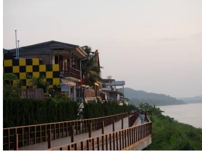
ຖະຫນົນຊາຍຂອງ ຍ່ານເຮືອນໄມ້ເກົ່າ