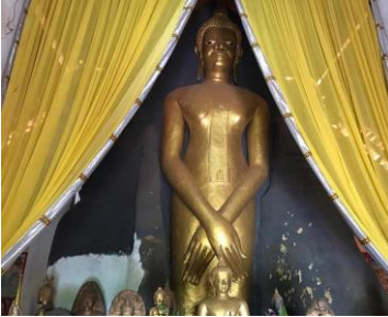
ວັດໃຫຍ່ຜາຫົດ