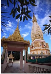
ພະທາດສັດຈະ