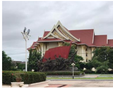
ພິພິທະພັນໄກສອນ ພິມວິຫານ