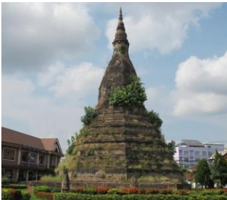
ພະທາດຕໍາ