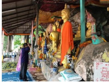
ວັດຖ້າພະ