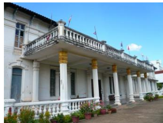
ຫໍພິພິທະພັນແຫ່ງຊາດ