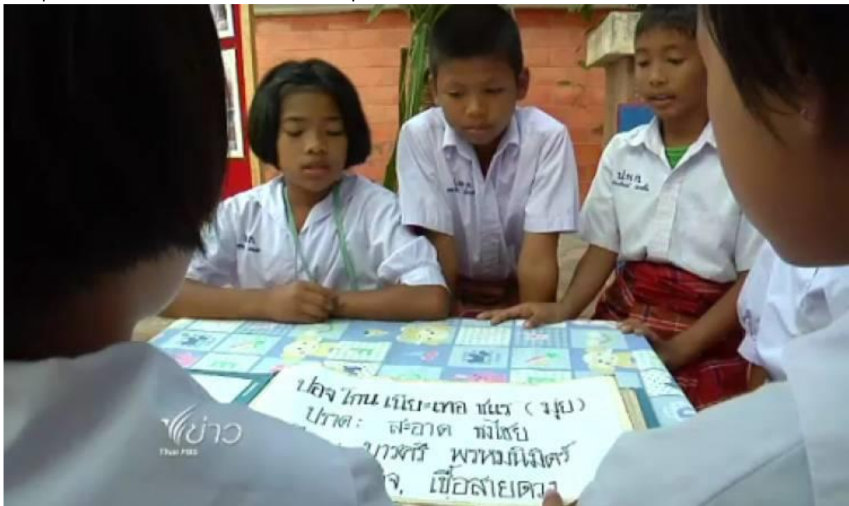
រូបទី ២ សិស្សសាលារៀនភូមិពោធិកងកំពុងរៀនភាសាខ្មែរសុរិន្ទ្រដោយប្រើអក្សរថៃ

ប្រើភាសាខ្មែរ បែរជាចូលចិត្តនិយាយគ្នាជាភាសាថៃ ។ អ្នកដែលប្រើភាសាខ្មែរជាអ្នកដែលរស់នៅតាម ស្រុកស្រែចំការ ប៉ុន្តែអ្នកទាំងនោះក៏មិនបានប្រើភាសាខ្មែរទាំងអស់ដែរ ។ នេះចាត់ទុកថាជាវិបត្តិមួយ សម្រាប់ភាសាខ្មែរក្នុងប្រទេសថៃ ។ មានក្រុមការងារ ក៏ដូចជាស្ថាប័នមួយចំនួនព្យាយាមអនុវត្តរក្សា ភាសាខ្មែរសុរិន្ទ្រឲ្យបានគង់វង់ តាមរយៈការបំផុសឲ្យមានការបើកបង្រៀនភាសាខ្មែរសុរិន្ទ្រនៅតាម បណ្តាសាលារៀននានា ។ ក្នុងនោះ សាលារៀនភូមិពោធិកងបានចាប់ផ្តើមដំណើរការបង្រៀន ដោយ មានការសហការជាមួយសាកលវិទ្យាល័យមហិឌុល ។ ប៉ុន្តែកម្មវិធីសិក្សាមិនបានប្រើប្រាស់អក្សរខ្មែរ ក្នុងការសរសេរទេ គឺគេប្រើអក្សរថៃក្នុងការសរសេរពាក្យខ្មែរសុរិន្ទ្រទាំងនោះ ។ ប្រការនេះអាចមកពី នៅក្នុងខេត្តមានការខកខានប្រើអក្សរខ្មែរក្នុងរយៈពេលយូរយារមកហើយ ។