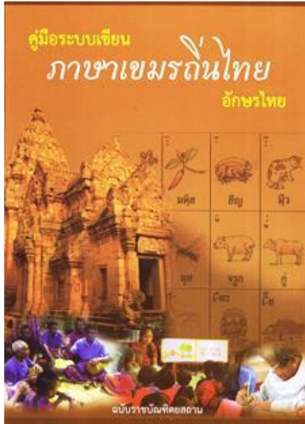
រូបទី ៣ ឯកសារណែនាំអំពីការសរសេរភាសាខ្មែរសុរិន្ទដោយអក្សរថៃ ច្បាប់បោះពុម្ព ដោយរាជបណ្ឌិត្យសកាថៃ

ទន្ទឹមនឹងនោះ ការអនុវត្តភាសាខ្មែរសុរិន្ទដែលលេចធ្លោរជាងគេ គឺនៅក្នុងខេត្តសុរិន្ទមានអ្នកនិពន្ធនិងសិល្បករច្រើន ។ ក្រៅពីនេះនៅមានហាងមួយចំនួនបានជួយឧបត្ថម្ភក្នុងការតែងនិពន្ធនិងការច្រៀងចម្រៀងកន្លឹមផងដែរ ដូចជា ផែរោចន៍សោនជី ។