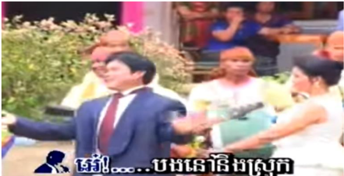
រូបទី ៦ កន្លឹមខាវ់អូខេដោយតួអក្សរខ្មែរ

នៅក្នុងខាវ់អូខេទាំងនោះ ក៏មានការប្រើតួអក្សរខ្មែរស្តង់ដារសម្រាប់យកទៅផ្សព្វផ្សាយនៅប្រទេសកម្ពុជាផងដែរ ដោយហេតុថា ខ្មែរភាគច្រើននៃប្រទេសកម្ពុជាមានការនិយមចម្រៀងប្រភេទនេះដែរ ។ ចំណុចនេះបង្ហាញឲ្យឃើញថា ការអនុវត្តភាសាខ្មែរសុរិទ្ធិបានធ្វើឡើងផងដែរតាមរយៈសិល្បៈកន្លឹម ។