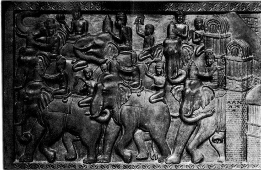
ภาพที่ ๔ กษัตริย์ทั้ง ๘ นคร เชิญพระบรมสารีริกธาตุ ประดิษฐานในผอบขึ้นหลังช้างกลับเมืองของตน ภาพพุทธประวัติหินสลัก ศิลปะอมราวตี สมัยอันธระ พ.ศ.๔๐๐ - ๗๐๐ ที่มา : พุทธประวัติจากหินสลัก

พระสถูปบรรจุพระสรีระมีแปดแห่ง เป็นเก้าแห่งทั้งสถูปบรรจุพระสรีระเป็นสิบแห่งทั้งพระสถูปบรรจุพระอังคาร ด้วยประการฉะนี้ การแจกพระธาตุและการก่อพระสถูปเช่นนี้ เป็นแบบอย่างมาแล้ว ฯ...” (มหาปรินิพพานสูตร)