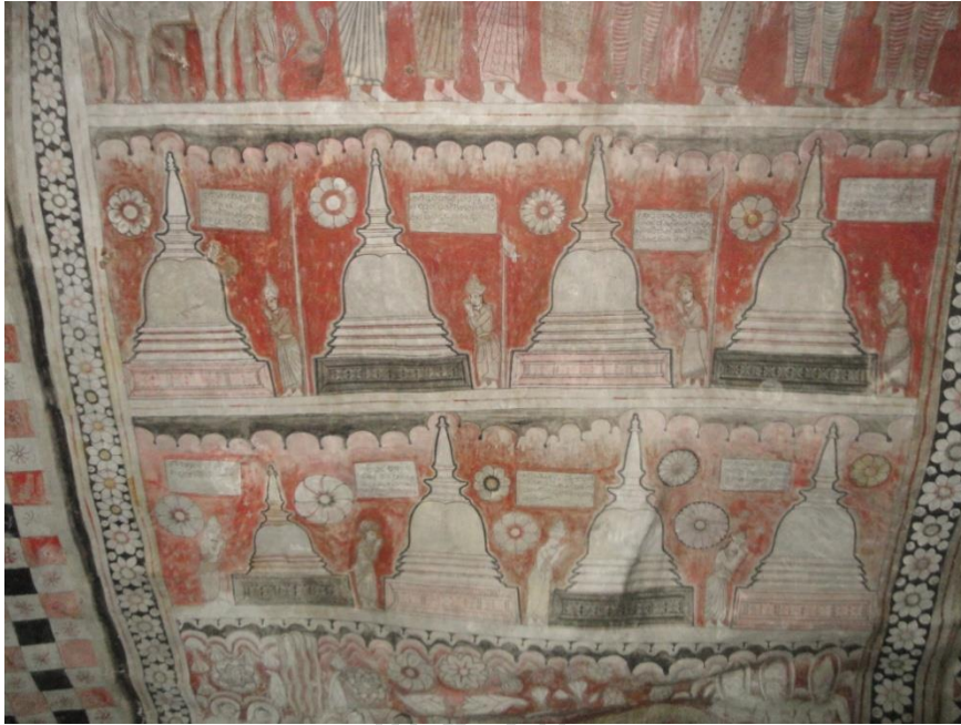
ภาพที่ ๑ พระสถูปบรรจุพระบรมสารีริกธาตุ ๘ องค์แรกของโลก จิตรกรรมฝาผนังภายในวัดทัมพูละ ราชมหาวิหาร ประเทศศรีลังกา ภาพเมื่อวันที่ ๒๖ พฤษภาคม ๒๕๕๙

ภาพจิตรกรรมฝาผนังบนเพดานของถ้ำทัมพูละที่ ๒ หรือถ้ำ “มหाराชเลนยะ” (ถ้ำมหาราชาวิหาร ภายในวัดทัมพูละ ราชมหาวิหาร ประเทศศรีลังกา นักประวัติศาสตร์ศิลปะกำหนดอายุจิตรกรรมเหล่านี้ว่าเป็นศิลปะแคว้นตีราวปลายพุทธศตวรรษที่ ๒๓ ถึงต้นพุทธศตวรรษที่ ๒๔ ในรัชกาลของพระเจ้ากิริติศรีราชสิงหะ (พ.ศ. ๒๒๙๐-๒๓๒๔) โดยเขียนเล่าเรื่องพุทธประวัติ และเรื่องอื่น ๆ บนเพดานของถ้ำที่ได้รับการดัดแปลงเป็น “ปฏิมาขระ” (อาคารสำหรับใช้ประดิษฐานรูปเคารพ) ของอารามแห่งนี้