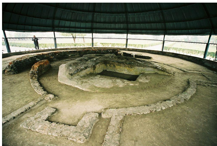
ภาพที่ ๕ ซากพระสถูปที่กษัตริย์ลิจฉวีสร้าง ที่เมืองเวสาลีในปัจจุบัน