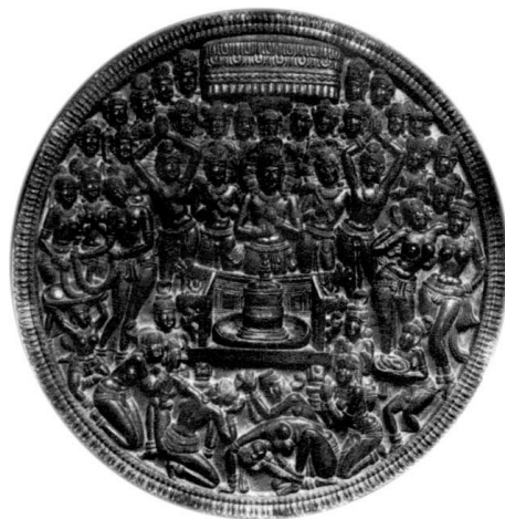
ภาพที่ ๖ กษัตริย์เมืองรามคาม ฉลองพระบรมสารีริกธาตุที่ได้รับแบ่งมา พุทธประวัติหินสลัก ศิลปะอมราวตี สมัยอันธระ พ.ศ.๔๐๐ - ๗๐๐

สถูปทั้ง ๘ แห่งนี้ เชื่อกันว่าเป็นสถูปที่มีอยู่จริง หลายแห่งได้มีการค้นพบทางโบราณคดี เป็นซากโบราณสถานในเมืองต่าง ๆ แล้ว อาทิ เวสาลี กบิลพัสดุ์ อัลกัปปะ รามคาม (เทวทหะ) ส่วนในจิตรกรรมฝาผนังของถ้ำทัมพูละ นี้จะสังเกตได้ว่า มีลักษณะเป็นมหาสถูปทรงกลมแบบลังกา ในหนึ่งกรอบ มี ๒ ชั้น แต่ละชั้นมีสถูป ๔ องค์ ชั้นบนมีกษัตริย์หรือบุคคลชั้นสูง พนมมืออภิวาทเบื้องซ้ายของพระสถูป ทั้ง ๔ องค์ ชั้นล่างมีกษัตริย์หรือบุคคลชั้นสูง พนมมืออภิวาทเช่นเดียวกัน หากแต่เป็นเบื้องขวาของพระสถูป พระสถูปทุกองค์ นอกจากจะมีลวดลายดอกไม้ประดับแล้ว ยังมีการจารึกอักษร (เข้าใจว่าเป็นอักษรสิงหล) ที่น่าจะบรรยายว่าสถูปองค์นี้เป็นสถูปของเมืองอะไร เพื่อสร้างความเข้าใจให้แก่ผู้ชม นอกจากนี้แม้ลังกาจะมีตำนานพุทธศาสนาที่พระพุทธเจ้าเสด็จมาโปรดถึง ๓ ครั้ง และสร้างพระสถูปเจดีย์แล้ว ภาพนี้ยังอาจเกี่ยวข้องกับความเชื่อที่ว่าพระสถูปวันเวลีเสยะ หรือ “มหาสถูป” ณ มหาวิหาร เมืองอนูราธปุระ เป็นที่ประดิษฐานพระบรมสารีริกธาตุจากพระสถูปเมืองรามคาม ซึ่งพญานาคเป็นผู้พิทักษ์รักษาไว้ และนำมาบรรจุในพระเจดีย์ดังกล่าว