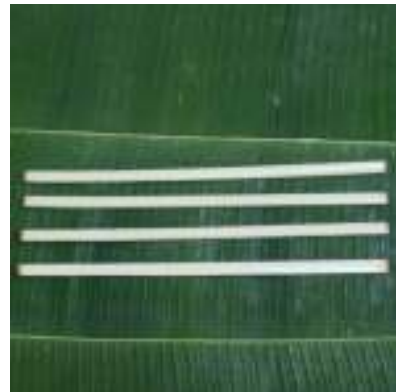
ลายประกอบได้แก่ นกน้อย ตีนเต่า ฟันห้า ฟันสาม แหว่หมา