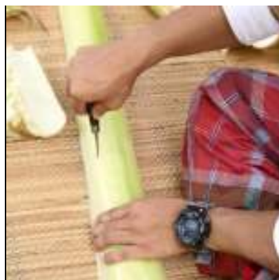
ลักษณะการจับมีดในการแทงหยวก