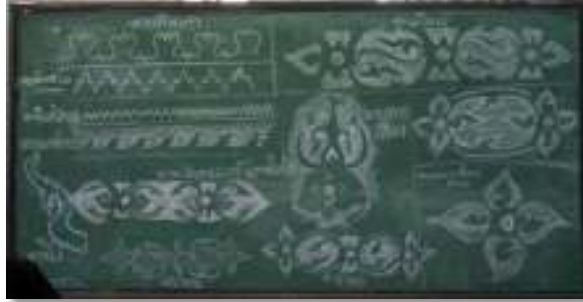
ลวดลายต่างๆของการแทงหยวกบ้านโพนทราย

๒. การออกแบบและการแกะลวดลาย ส่วนประกอบสำหรับตกแต่งตัวปราสาทตามคติความเชื่อในพุทธศาสนา แต่เดิมใช้การแทงหยวกสำหรับเป็นส่วนประกอบโครงไม้ไผ่ ลวดลายที่นิยมมีหลายเข้า พรหม ลายโหง่ ลายแฉ่วหมา ลายตีนเต่า และลายนาคย่อย บางแห่งใช้การแกะลาย ปั้นลาย ด้วยซี่ผึ้งที่ติดกับกรอบไม้ หรือการหล่อลายด้วยแม่พิมพ์มาติดประดับในภายหลังด้วยการใช้ความร้อน (ตามแบบประยุกต์) แต่บ้านโพนทรายยังคงรักษารูปแบบและวิธีดั้งเดิมที่ได้รับการสืบทอดมาอยู่ถึงปัจจุบัน