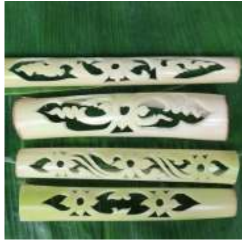
ลายใหญ่คือลายเครือเถาว์