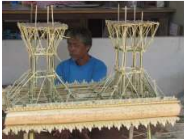
ลักษณะการหักหอบ้าง ทำจากไม้ไผ่