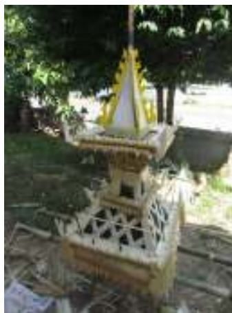
ลักษณะต้นผึ้งและหอผึ้งแบบต่างๆ