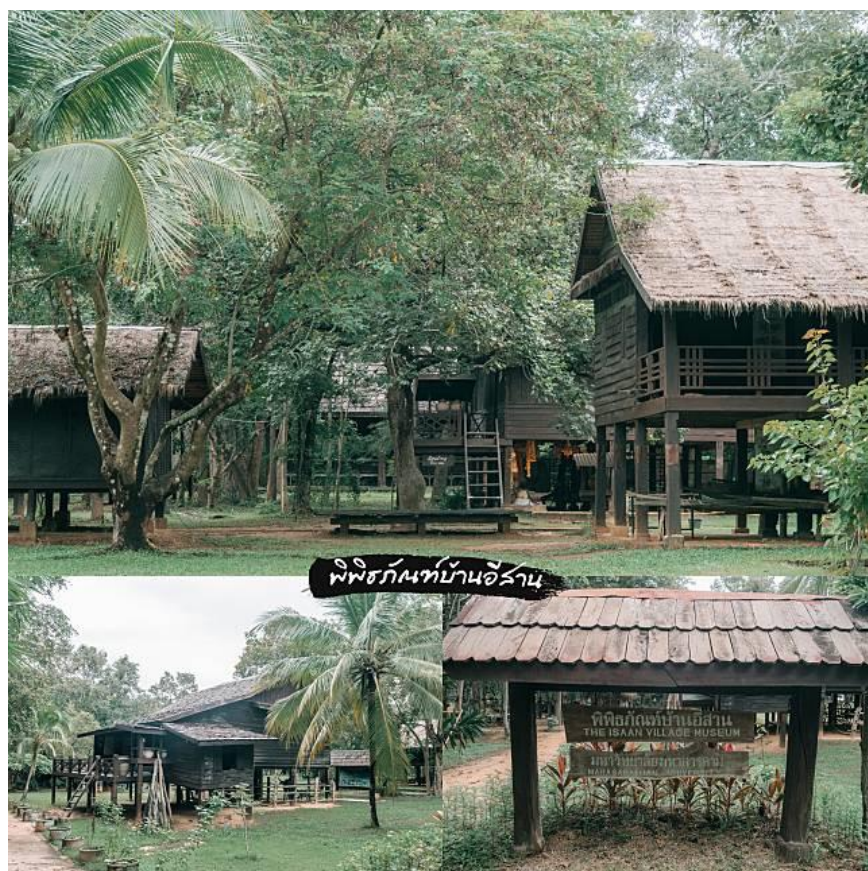
ภาพประกอบ 2 พิพิธภัณฑสถานอีสาน สถาบันวิจัยวลัยรุกขเวช มหาวิทยาลัยมหาสารคาม (สถานีปฏิบัติการนาตุน) ( https://today.line.me/th/v2/article/v0Jw2 )