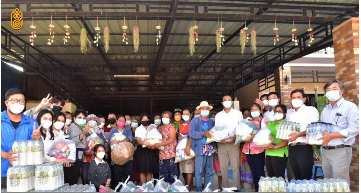
สถาบันวิจัยศิลปะและวัฒนธรรมอีสานร่วมกับวัดศรีสวัสดิ์ มอบของช่วยเหลือผู้ประสบภัยอุทกภัย ณ บ้านท่าตม ตำบลท่าตม อำเภอเมือง จังหวัดมหาสารคาม