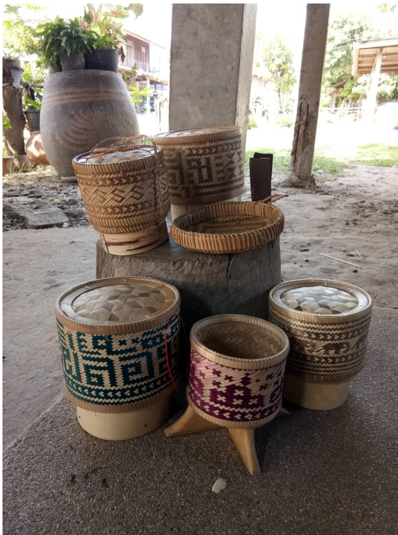
ผลิตภัณฑ์กระติบข้าว