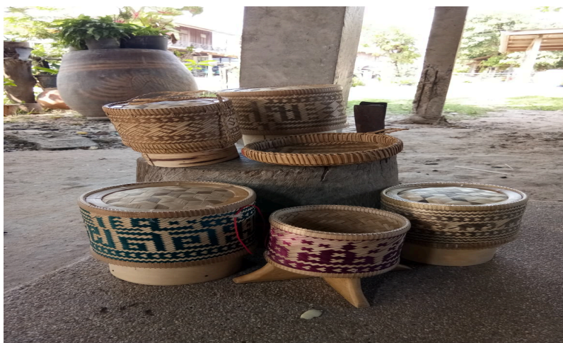
1.ประเด็นพัฒนามาตรฐาน เพื่อยกระดับผลิตภัณฑ์ เตรียมยื่นขอมาตรฐานผลิตภัณฑ์โอทอปที่สูงขึ้น