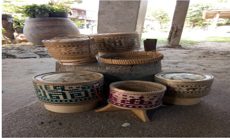
กระติบข้าวเหนียว