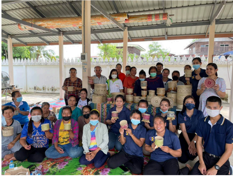
รูปภาพรวมสมาชิกกลุ่ม