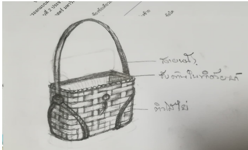
ประเด็นพัฒนา นวัตกรรมผลิตภัณฑ์การย้อมสีธรรมชาติ เพื่อเพิ่มความหลากหลายและ เพิ่มมูลค่าผลิตภัณฑ์