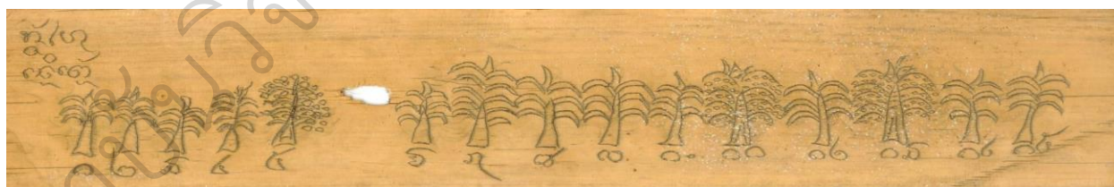
ภาพที่ 1 ตัวอย่างยามปลูกพืชพันธุ์ จากใบลานสั้น(ลานก้อม)โหราศาสตร์อีสาน.

จากตำราพรมชาติ ได้สะท้อนความคิดเรื่อง ความเชื่อด้านจักรวาลวิทยาแบบชาวบ้าน ที่ใช้ข้าวเป็นเหมือนปฏิทินแห่งฤดูกาล เพราะการทำนาจำเป็นต้องมีความสอดคล้องกับฤดูกาล ผ่านการลองผิดถูกและเก็บสถิติต่าง ๆ จนสามารถนำมาเขียนภาพอย่างง่ายสื่อถึงยามในข้างขึ้น ข้างแรม ที่เหมาะสมกับการเพาะปลูกที่ได้ผลผลิตที่เต็มเม็ดเต็มหน่วย ดังภาพที่ 1 และ ภาพที่ 2 อีกอย่างก็คือเป็นจิตวิทยาสำหรับชาวนาโบราณที่มีที่พึ่งสำหรับการทำการเกษตรที่ต้องพึ่งพาฟ้าฝนเป็นสำคัญ นาปี จึงเป็นเหมือนปฏิทินแห่งวิถีชีวิต ที่สามารถกำหนดรูปแบบวิถีของสังคม วัฒนธรรมผ่านทางรูปแบบประเพณีพิธีกรรม ซึ่งสามารถแบ่งออกเป็น 5 ช่วง ได้แก่ 1) พิธีกรรมบวงสรวง อ้อนวอน เสี่ยงทาย 2) พิธีกรรมเพื่อการเพาะปลูก 3) พิธีกรรมเพื่อการบำรุงรักษา 4) พิธีกรรมเพื่อการเก็บเกี่ยว และ 5) พิธีกรรมเพื่อเฉลิมฉลอง นอกจากนี้ยังพบว่า มีการใช้ความเชื่อเกี่ยวกับยันต์เพื่อใช้ป้องกันศัตรูโดยธรรมชาติของพืชอีก ดังภาพที่ 3 ตัวอย่างยันต์กันหนูกัดทะข้าวของและพืชผล